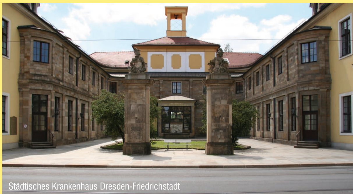
Städtisches Krankenhaus Dresden-Friedrichstadt