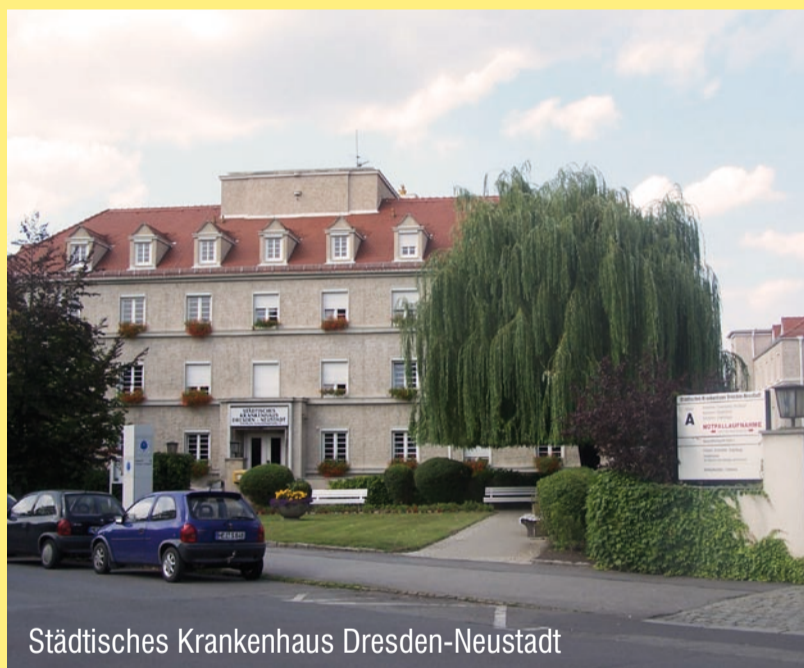
Städtisches Krankenhaus Dresden-Neustadt

Deswegen bitten wir Sie, beim Bürgerentscheid am 29. Januar 2012 mit „Nein“ zu stimmen!